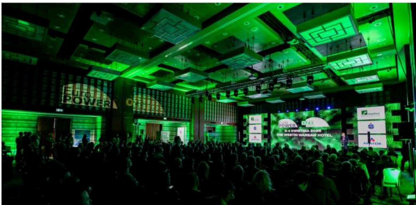
EuroPOWER & OZE POWER